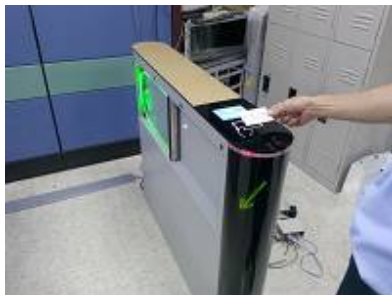
（用 RFID 借閱證感應開門）